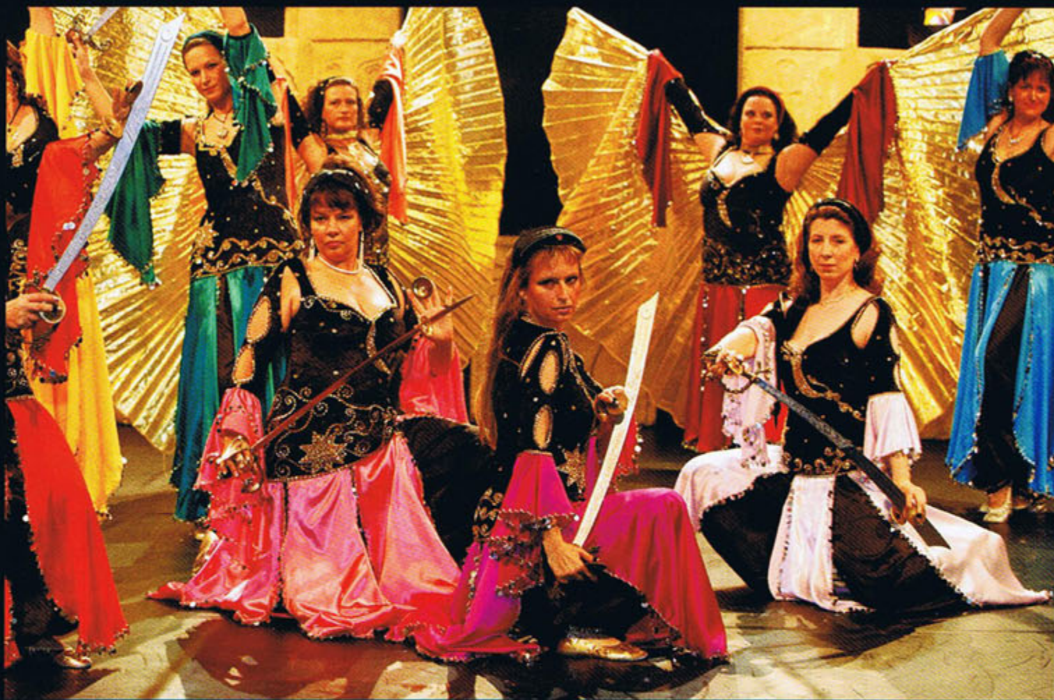
Al Hilala (HG)